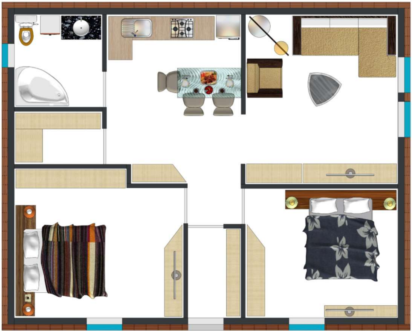
КОНЕЧНО, ПЛАНИРОВКА МОЖЕТ БЫТЬ ИЗМЕНЕНА